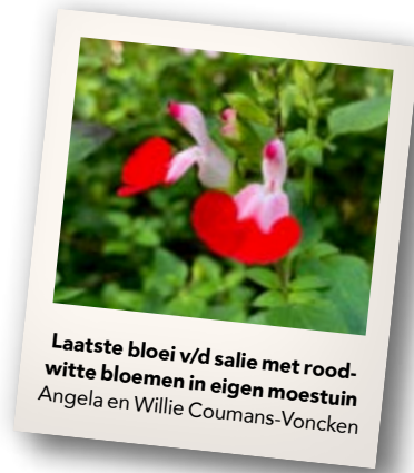
Laatste bloei v/d salie met rood- witte bloemen in eigen moestuin Angela en Willie Coumans-Voncken