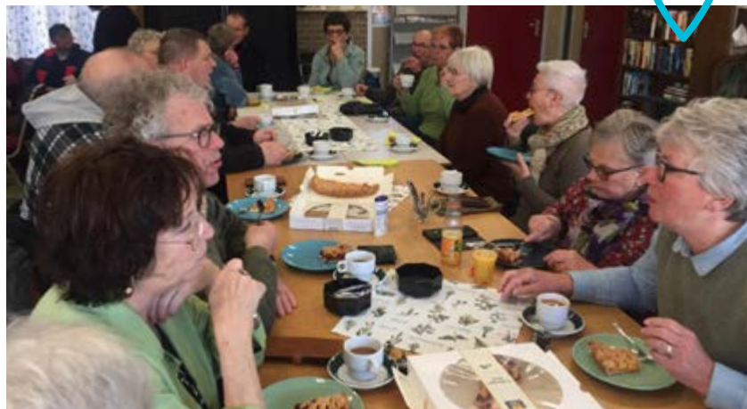
Gezelligheid tijdens de bloemschikmiddag